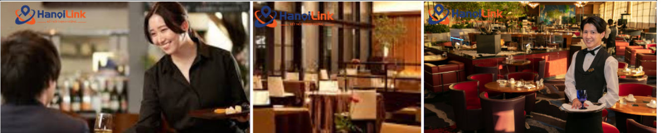
Chịu trách nhiệm chính đơn hàng: LT