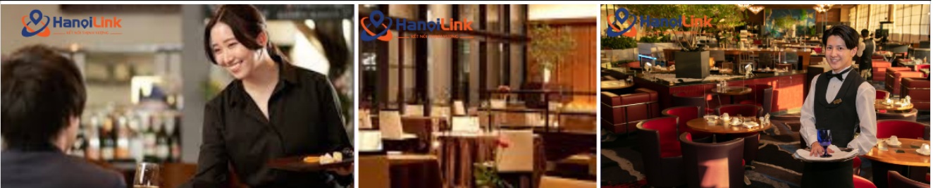
Chịu trách nhiệm chính đơn hàng: LT